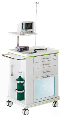
PLD 1181 Carros Curativo