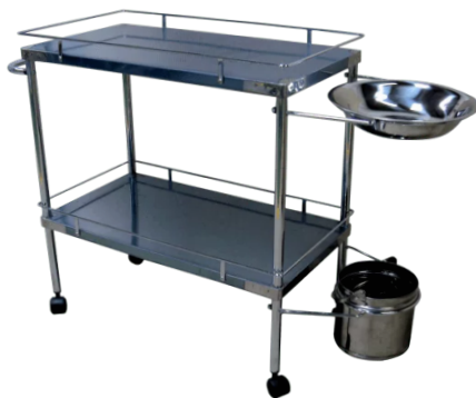
PLD 405 Carros Medicamento e Beira Leito